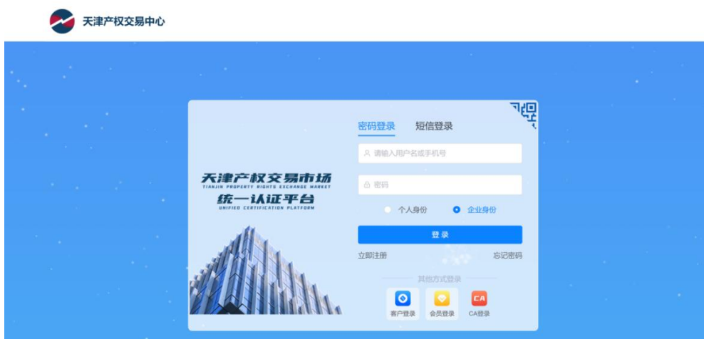
图2 专利开放许可平台登录界面

登录知识产权交易平台，网址： https://zscq.tpre.cn/ 。用户可以使用已经通过实名认证的账号（注册的手机号）和密码登录。