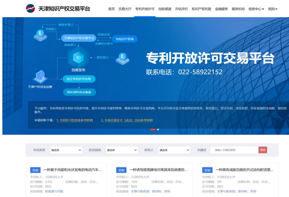
图3 专利开放许可交易平台信息发布展示页面

知识产权交易平台依据许可方提交的材料在交易平台发布信息披露公告。信息披露时间公告不少于5个工作日，自知识产权交易平台网站发布次日起计算。